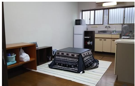
宿舎飯廳、客廳一角