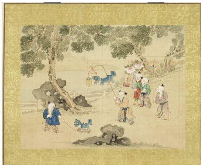
歡洽寰區 冊 第五開〈花燈會〉