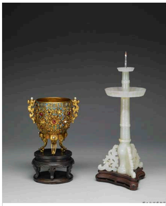
金甌永固杯、玉燭長調燭臺