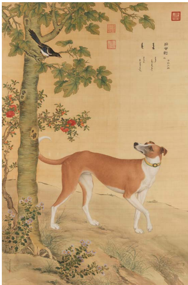
郎世寧 十駿犬茹黃豹