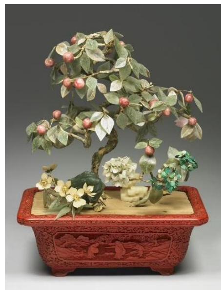
清 萬年青剔紅雕漆盆景