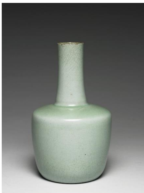
北宋 汝窯 青瓷紙槌瓶