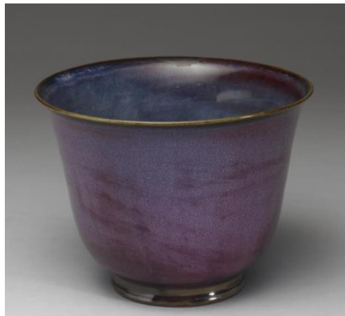
明 鈞窯 天藍窯變淺紫仰鐘式花盆