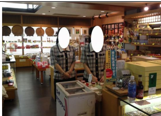
飯店內賣店(實習場所之一)