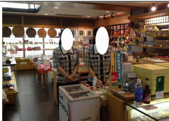
飯店內賣店(實習場所之一)