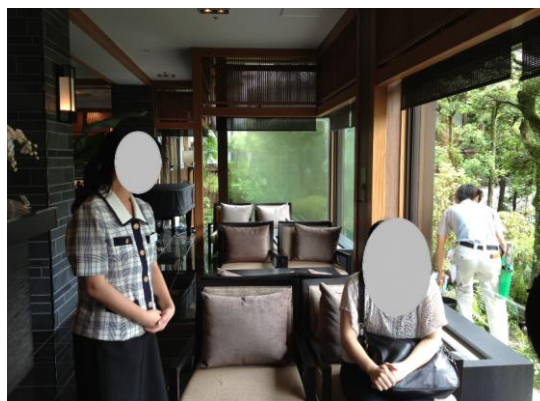
飯店一角(實習場所之一)