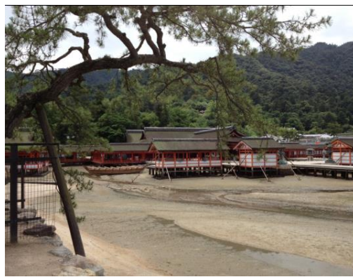
飯店附近景觀(日本三大景之一—嚴島神社)