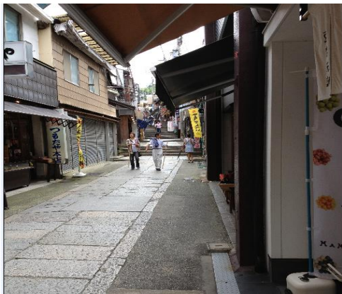
飯店附近景觀(金刀比羅宮參道)