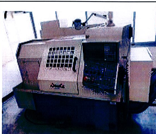
財產編號：3070101-11 名稱：電腦數值控制車床 金額：1,260,000