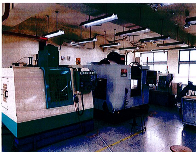
V棟目前空間放置設備現況