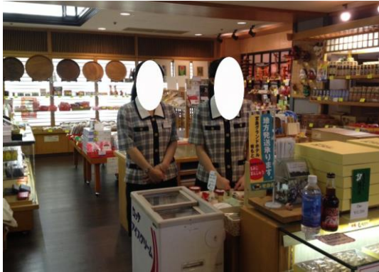
飯店內賣店(實習場所之一)