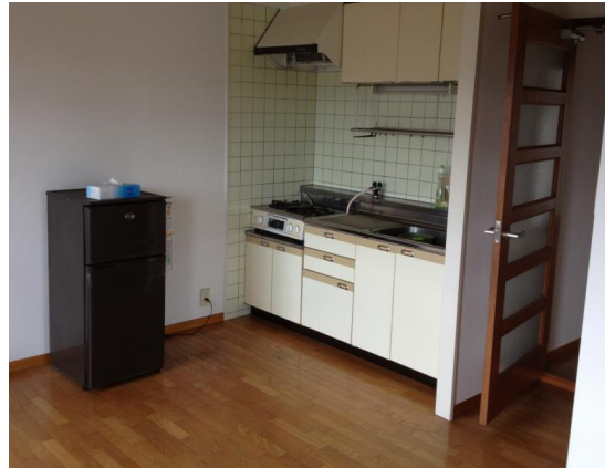
女生宿舍廚房一角