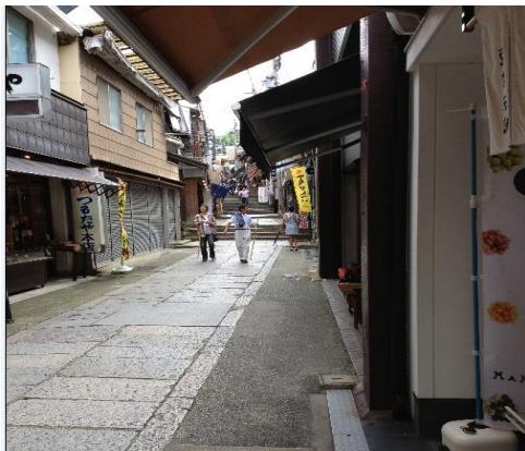
飯店附近景觀(金刀比羅宮參道)