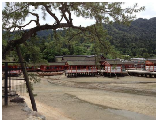
飯店附近景觀(日本三大景之一—嚴島神社)