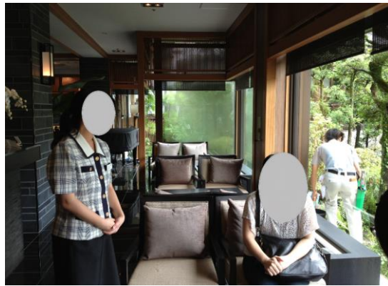
飯店一角(實習場所之一)