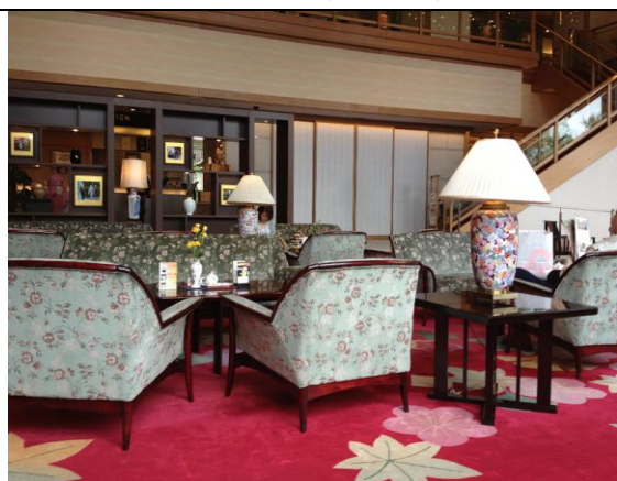
飯店大廳一角(實習場所之一)