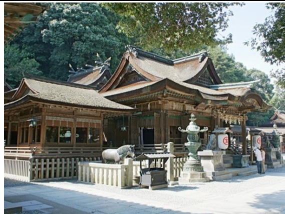
飯店附近景觀(金刀比羅宮)