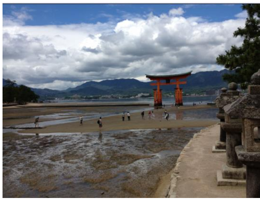
飯店附近景觀(日本三大景之一—嚴島神社)