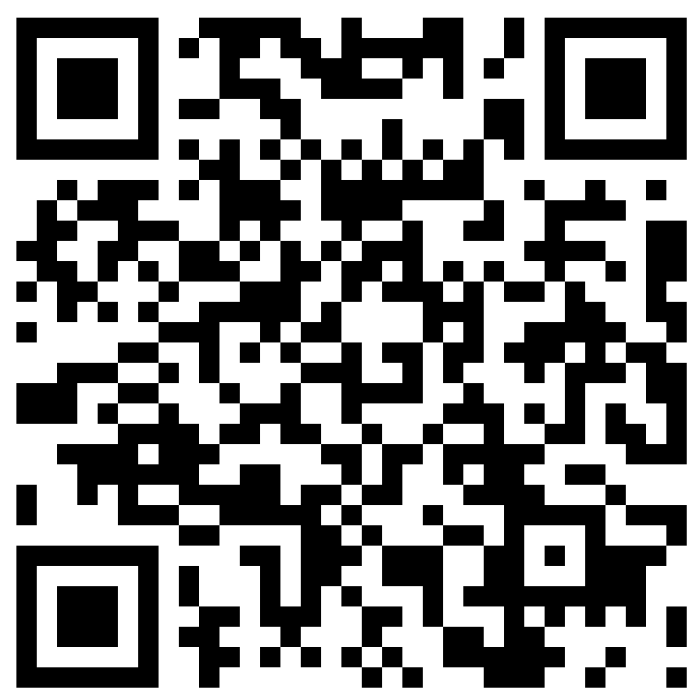
研討會報名網址 QR Code