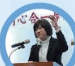
馬偕紀念醫院附屬醫院 醫師 教授