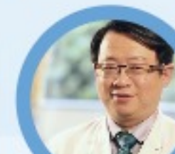
馬偕醫院附屬醫院 醫師 教授