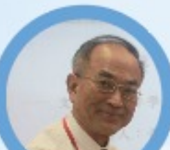
國立臺灣大學附屬醫院 醫師 教授