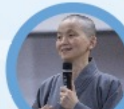
臺灣醫學教育學會 總幹事