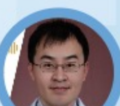
中山醫學院附屬醫院 醫師 教授