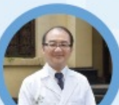
台大醫學院附屬醫院 醫師 教授