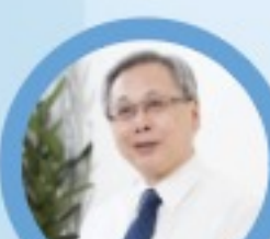
臺灣大學醫學院 醫師 教授