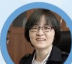
衛生署附屬醫院 醫師 司長