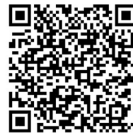
匯款資料回傳表單