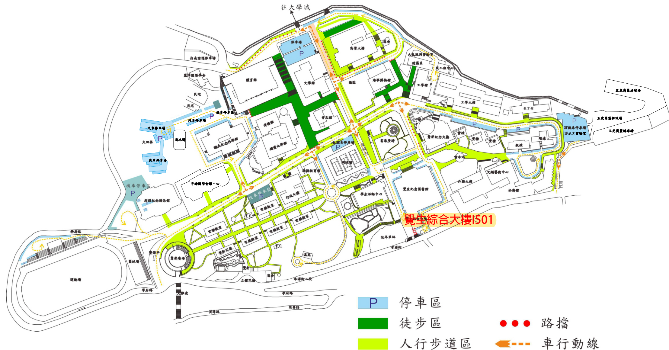
淡江大學人車分道規劃圖