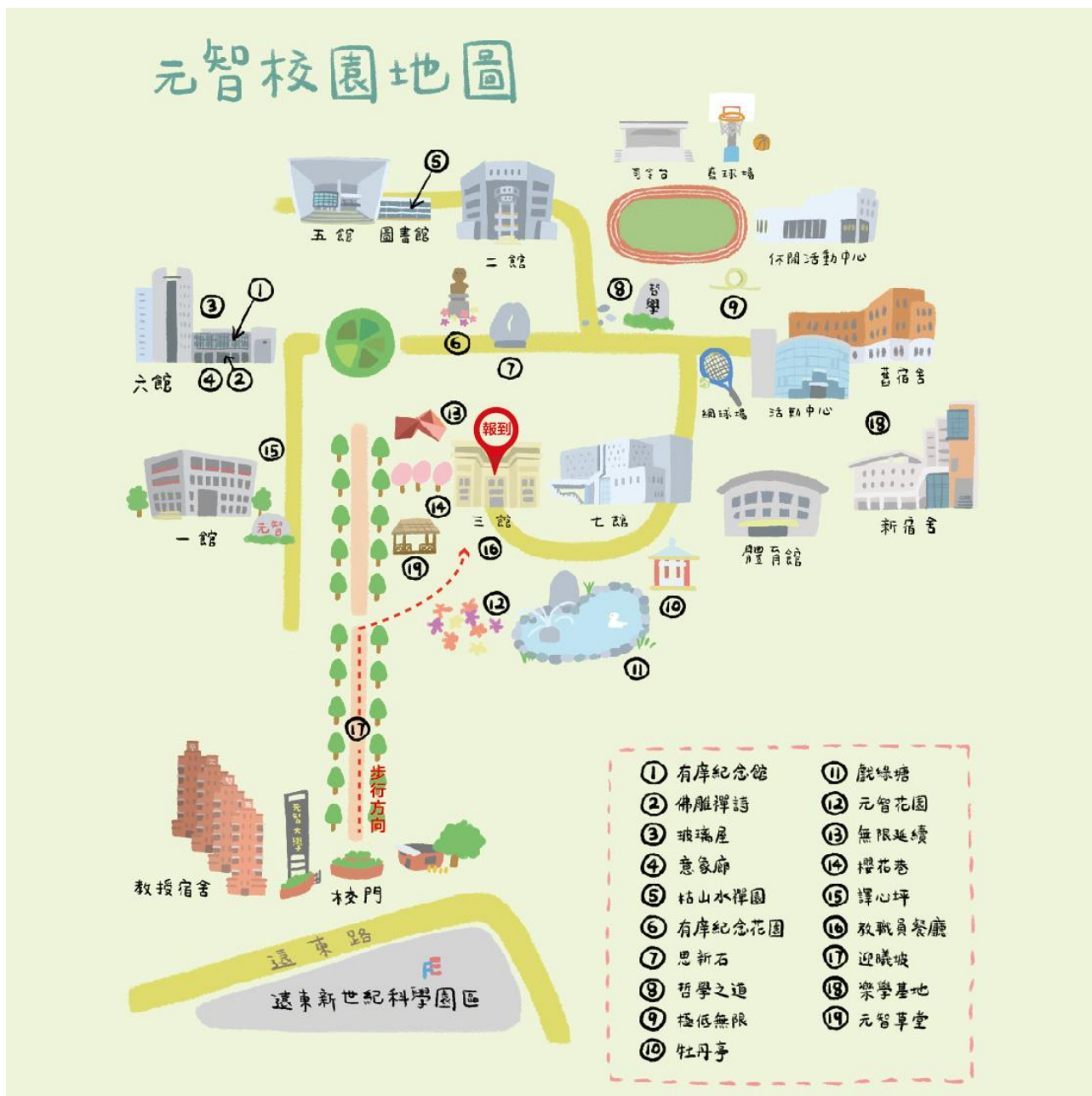
元智大學校區平面圖