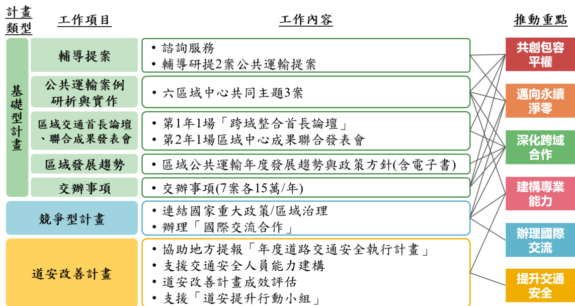
圖1 區域中心服務升級3.0計畫架構示意圖