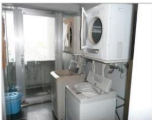
洗濯機・乾燥機(共用)