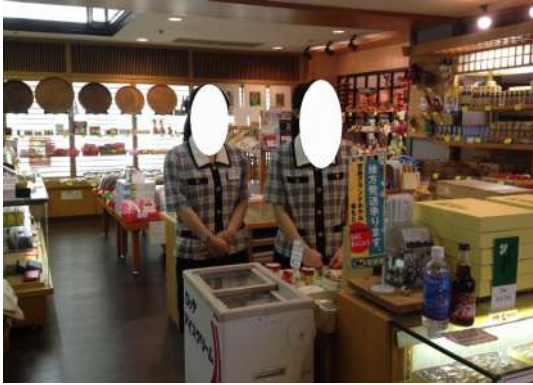
飯店內賣店(實習場所之一)