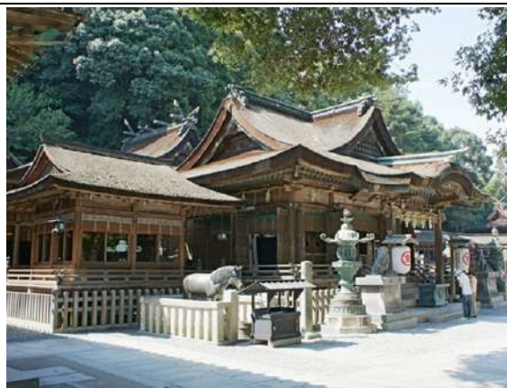
飯店附近景觀(金刀比羅宮)