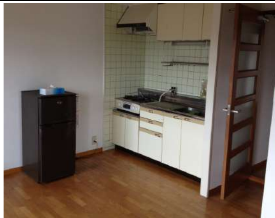
女生宿舍廚房一角