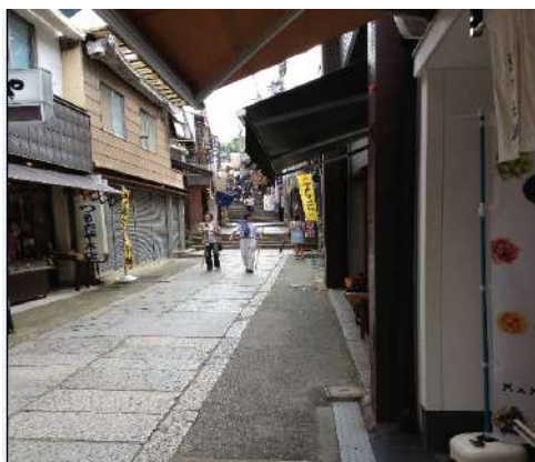
飯店附近景觀(金刀比羅宮參道)