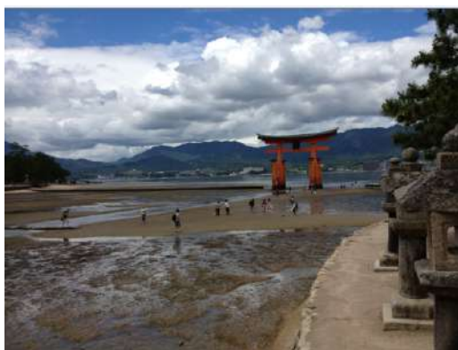
飯店附近景觀(日本三大景之一—嚴島神社)