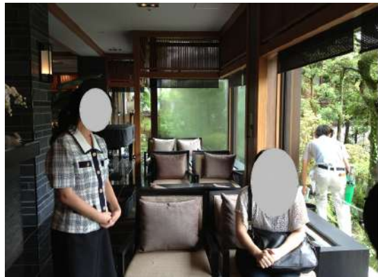
飯店一角(實習場所之一)