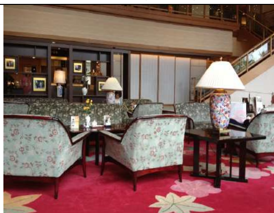
飯店大廳一角(實習場所之一)