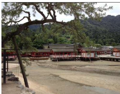
飯店附近景觀(日本三大景之一—嚴島神社)