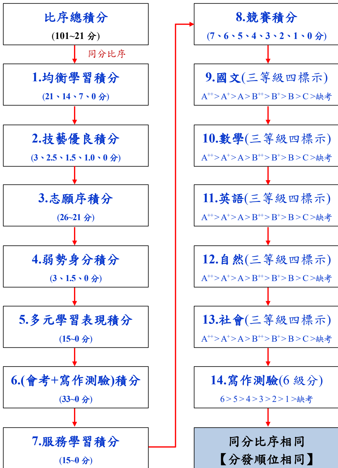
表 4-1 分發順位排定原則及同分比序順序

註：無論該科（組）是否採計國中教育會考，於同分比序皆為一致標準，均包含國中教育會考科目之比序。