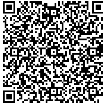
(報名連結 QR code)

請填寫 Google 線上報名表單，網址： https://reurl.cc/XAXbmE 。因場地限制，現場課程僅開放25人。如現場課程額滿，將由主辦單位以 E-mail 方式通知報名者改以線上參與。