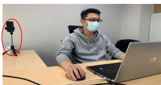
測驗期間需全程開啟視訊及麥克風，並將把手機放置於您坐定的座位斜後方的平台四點鐘或八點鐘方向