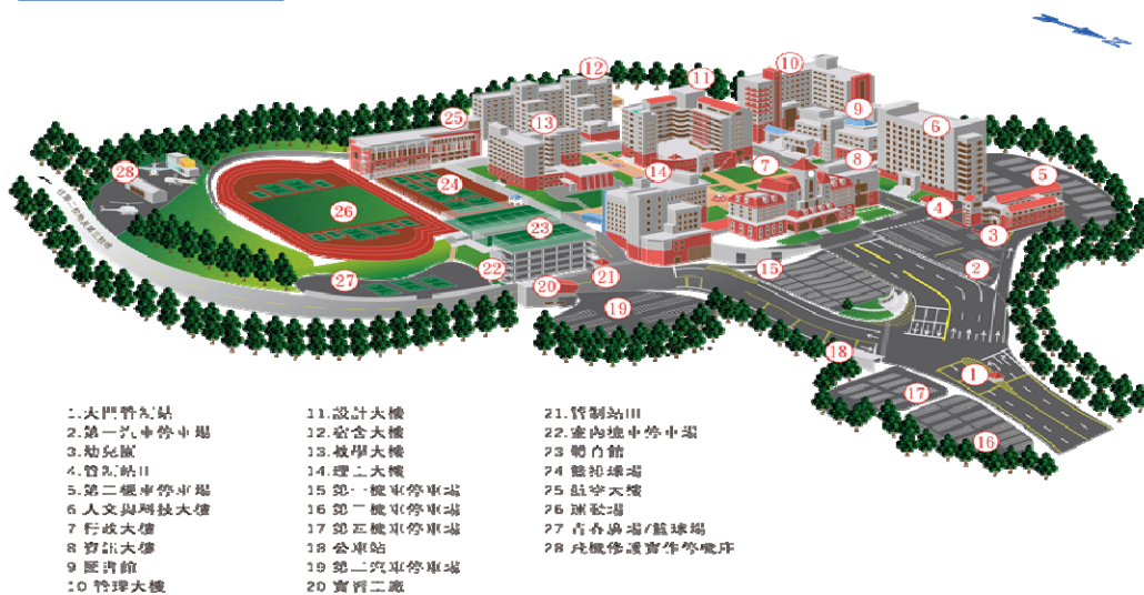
朝陽科技大學校園透視圖