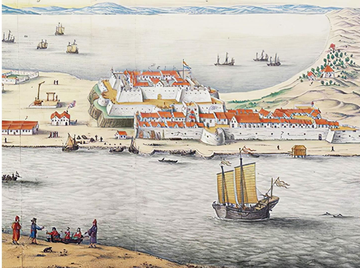
1664大員市街鳥瞰圖—Joan Blaeu，藏於荷蘭米德爾堡澤蘭博物館