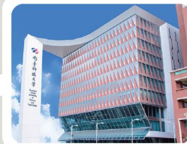
▲ 南臺科技大學大門照