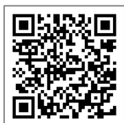
老爺酒店集團 飯店介紹