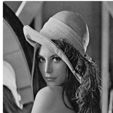
圖 1: 原始圖

圖形、表格及公式請依先後次序標號,標號請用半型阿拉伯數字,並將圖說撰寫於圖形下方置中,表格說明撰寫於表格上方置中。所附圖表請務必清晰並註明正確來源。