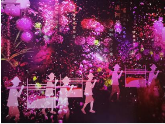
圖 15 將婚俗場景以投影方式呈現