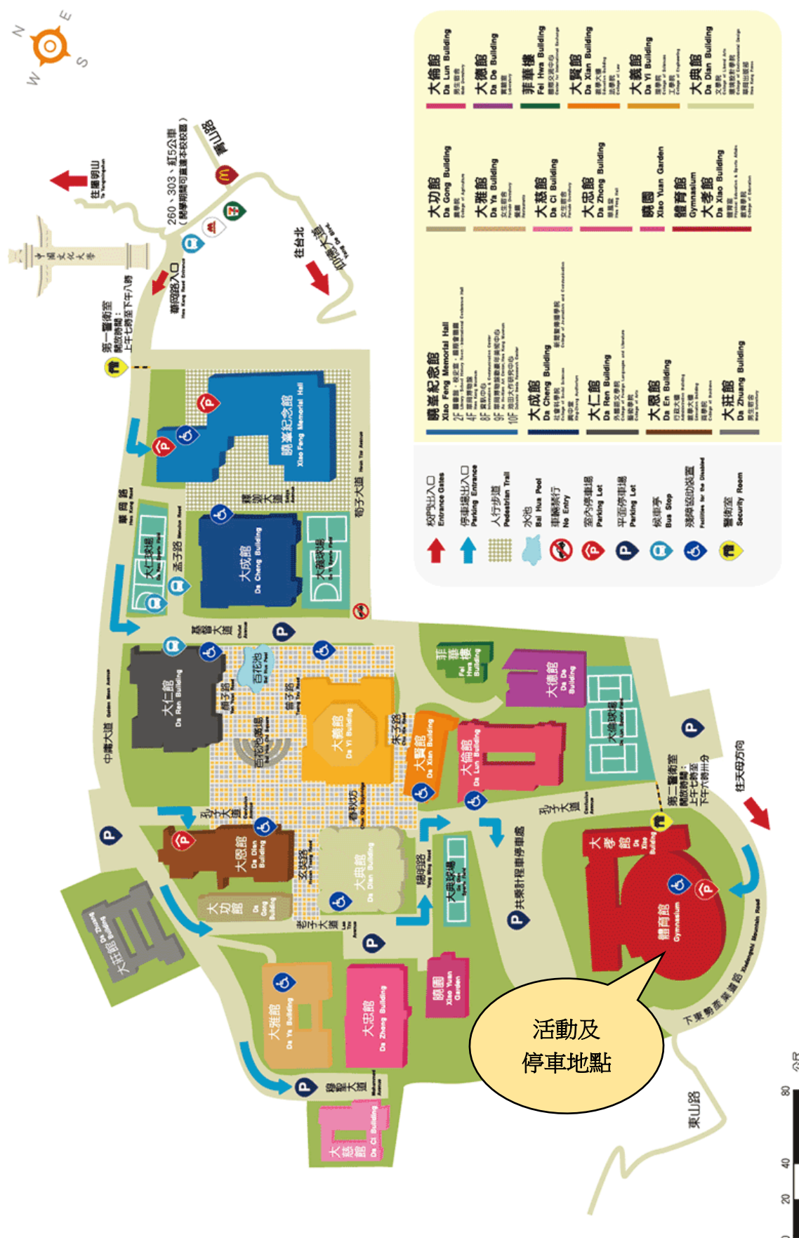
附件一 中國文化大學校區平面圖