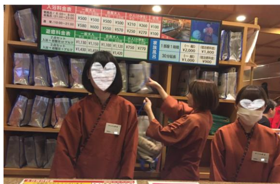
工作情形(フロント)