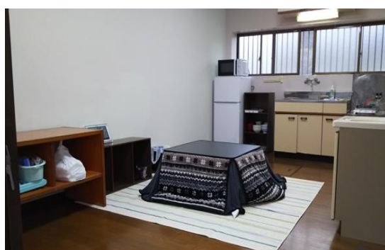
宿舍飯廳、客廳一角