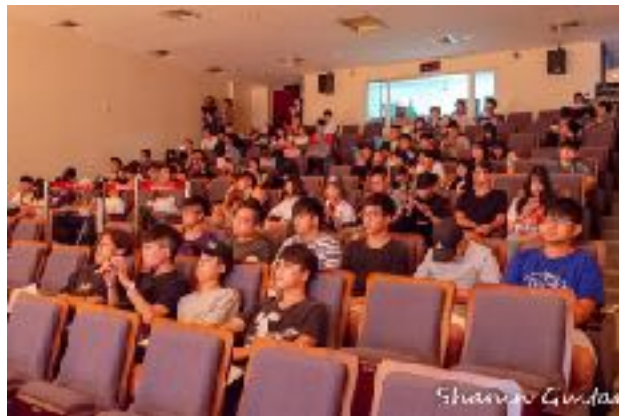
圖2 青永館6F采風堂圖（二）