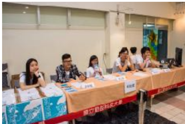
圖4 青永館6F靜軒廳圖（二）