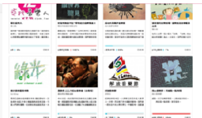
圖8 flying v群眾募資平台示意圖（二）