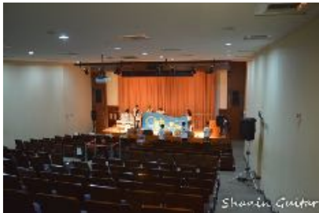
圖1 青永館6F采風堂圖（一）