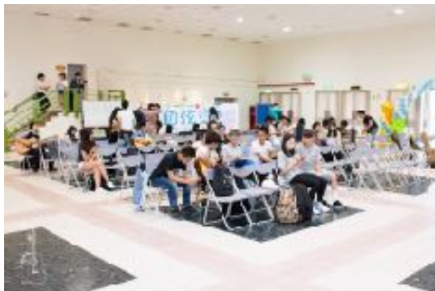
圖3 青永館6F靜軒廳圖（一）