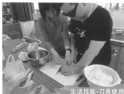
生活技能-刀具使用

食材選購、簡易食物烹調、衣物及環境整理、個人護理及衛生訓練、一般家電用品或3C電子用品操作等生活技能訓練。