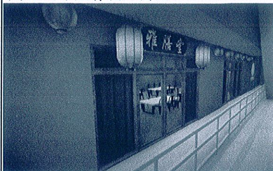
圖稿 1. 展場入口處利用背板營造復古氣氛 背板顏色以 tritigers5V 系列 HC663 色票為準