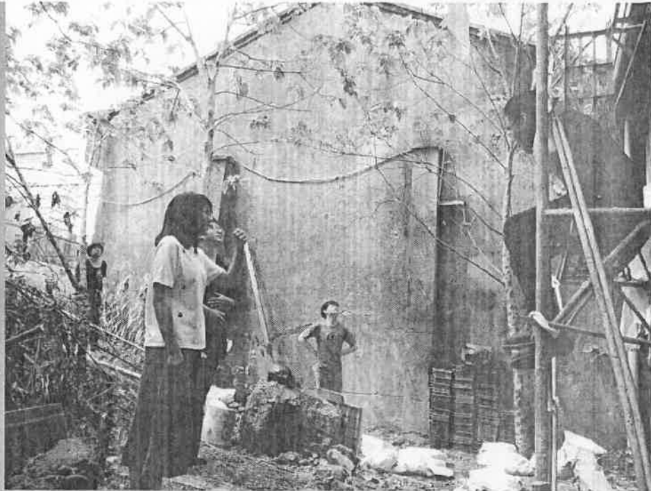
▲ 火車看台的打造。重建者老們過往的回憶。

每個地方都需要做夢的人， 但當這個夢想一直提出去， 卻沒有辦法被實現的時候， 那就會很痛苦， 也是我們離職的原因。