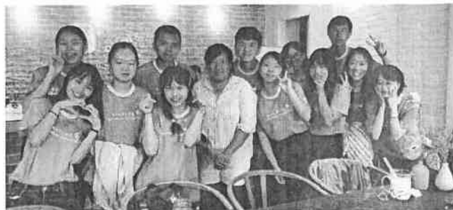
▲與馬祖高中生及大埔 Plus 夥伴們共同企劃如何保存在地文化

可曾想像「回家相聚」這件事在馬祖人身上是多麼的艱辛可貴。在外地留學的青年、在外地掙錢的壯年、大家都在異地夜以繼日的打拼著，有人是為了夢想、有人是為了三餐溫飽、更多人是為了良好的生活品質。僅有一間大學的馬祖，使得學生想尋求更好的教育資源，不得不到外地讀書，畢業之後，也就近尋找工作機會。隨著時間的流逝，對馬祖的眷戀也一點一滴慢慢地消失，正是馬祖所遇到的瓶頸。