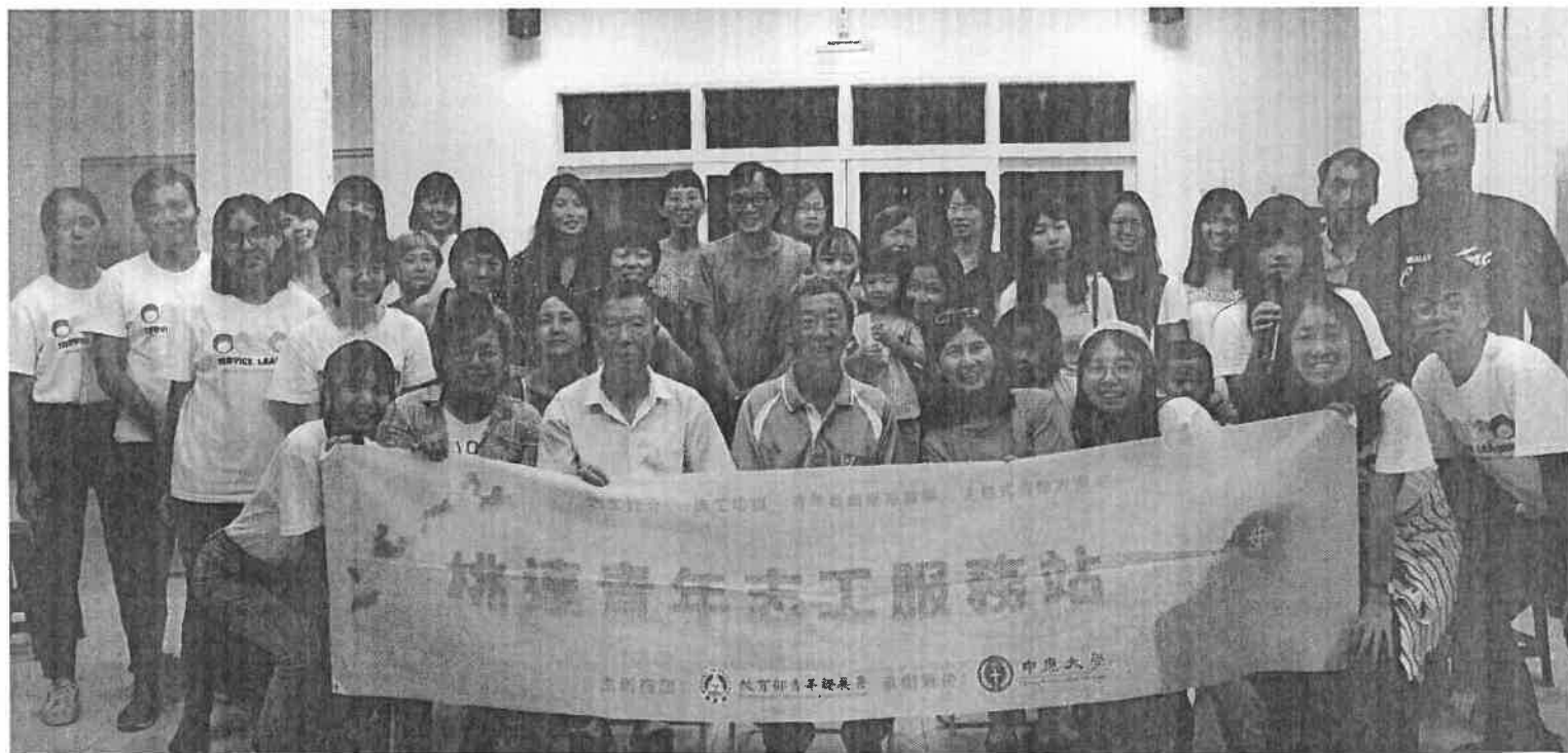
▼大埔 Plus 與馬祖夥伴們共同企劃如何保存在地文化

採訪的結尾，問到V落客成員對這次馬祖之行的收穫時，他們微笑地說：「服務結束後也許不會記得馬祖的風景有多美，但會永遠記得當地人有多美。」他們回憶到籌備初期，自己對馬祖的印象如教課書記載般受限，但在實際瞭解馬祖後發現還來得更更有溫度。親耳聽到馬祖高中的學生說出：「原來家鄉有這麼豐富的文化資源！」，也開始意識到文化傳承的重要與使命。對此，團隊明白一切值得，都是來自服務成果被受眾肯定。不熟悉自身家鄉的文化成為團隊的共同體悟，V落客從異鄉人的視角，看見他們眷戀馬祖的情感，將這份觸動，化為對傳承文化的使命感，以此為契機，開始積極參與家鄉舉辦的傳統活動，也希望將這份精神，延續在下一代的心中。