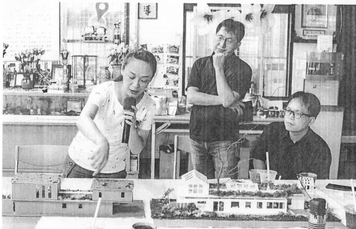
學生解釋對於三和社區創作的作品。