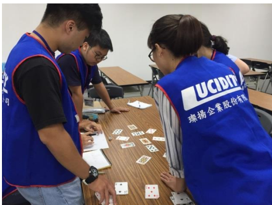
體驗式活動-紙牌記憶