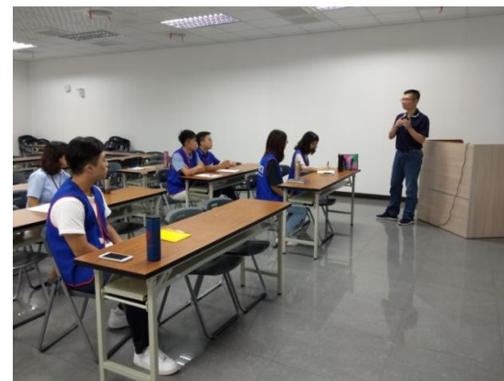
專題報告-主管回饋