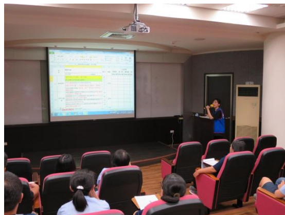
主管宣導作業會議