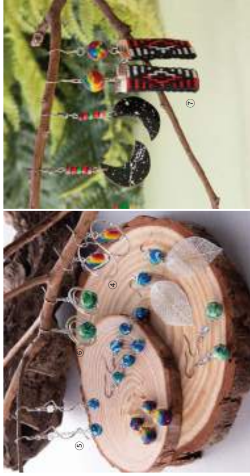
① 禮沐工作坊 | 織紋耳飾—圓形系列