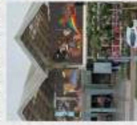
南投縣原之驛-Ba-Bu樂園