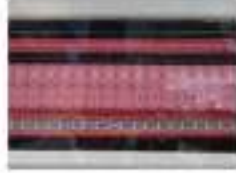
泰雅族禮用織品織框 獸桐工坊 尤瑪·達隆