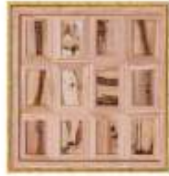
阿美族檳榔葉鞘畫 拿莉/Nature劉大衛

2016-2023 年蔡英文總統致贈外賓禮品 *2023 年致瓜拉庇拉總統禮品由副總統賴清德代表致贈