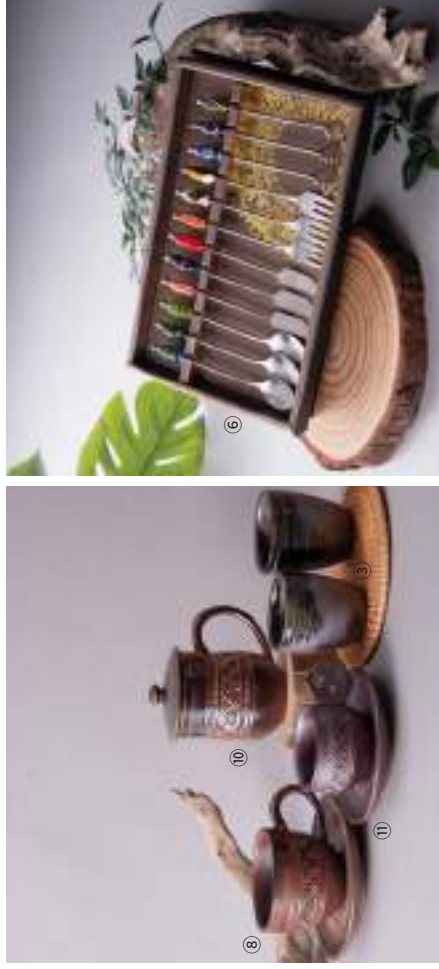
① 九鳥陶燒工作室 | 朋友