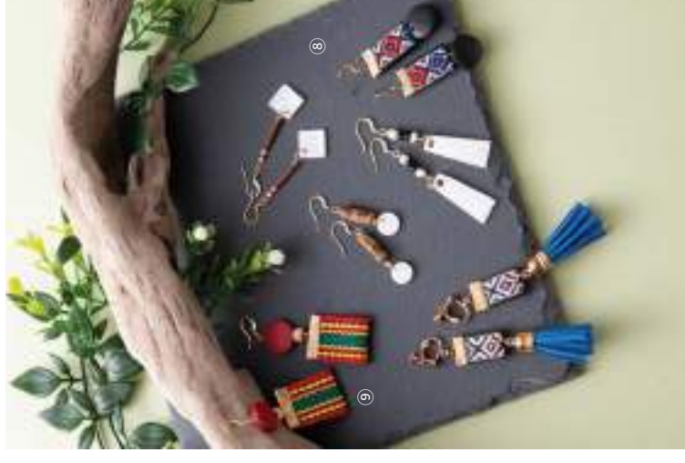
④ NAY 奈工藝坊 | 軟陶星系彩虹