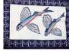
達悟族蠟染畫 蘭嶼強美(達悟)族的部落婦女