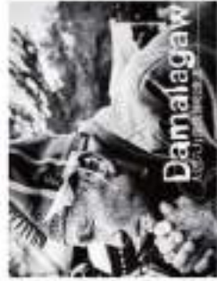
部落的盾牌、古老鈴鐺與 部落傳唱歌謠專輯 卑南族大巴六九