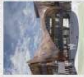
台南市安平區安平路47號