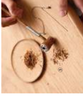
① 原味台南 | 陶珠項鍊系列 - 雙鍊