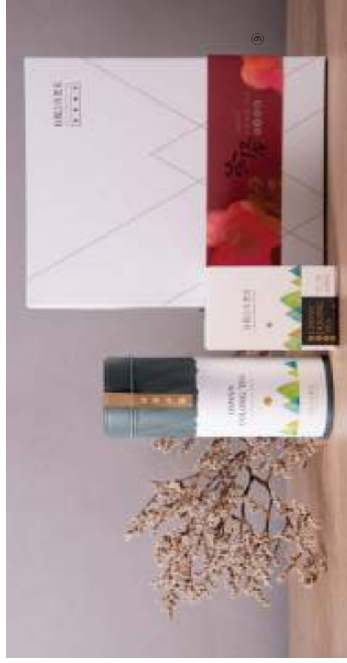
⑦ 橘色月亮亮文化工作室 | 背黑漆碗 $2800