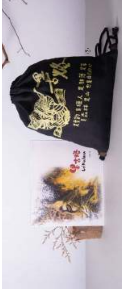
① 杏旦娃力絲工藝坊 | 山林祝福・拖特小包