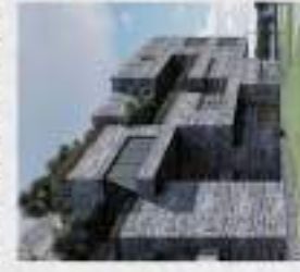
桃園國際原住民族文化創意產業園區二樓160樓