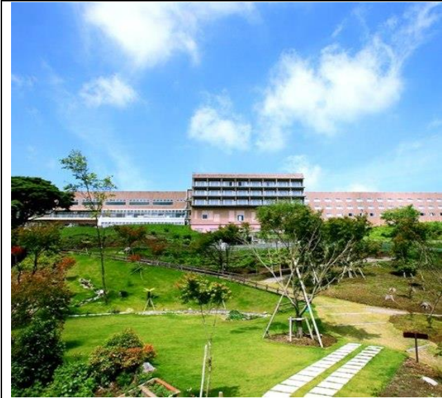
指宿ベイヒルズ外観

全体的に、清潔できれいなホテルです。砂蒸し風呂の体験もできます。お客様用レストランでも、食事をする事ができます。レストランから鹿児島湾を見渡すことができます。食材は地元産を使っているなので、新鮮です。