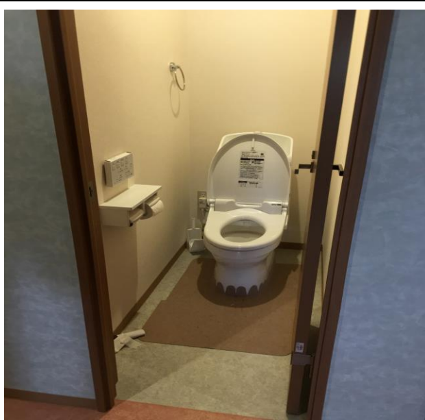
宿舎の清潔なトイレ