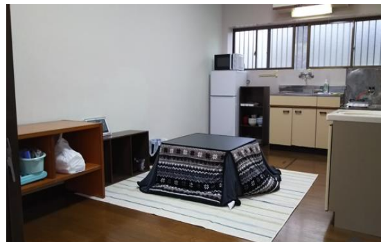
宿舍飯廳、客廳一角