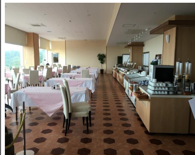
1階レストラン内部（職員使用可）