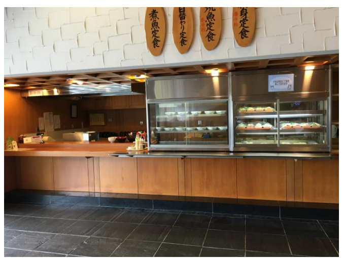
2階レストラン内部（職員使用可）